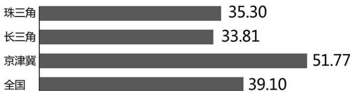
2020年人身保险深度指数

对此，《报告》建议，加快完善多支柱养老金体系建设，把个人养老储备能力和意愿有效转化为制度性的养老储备；充分考虑养老储备能力与家庭收入能力以及赡养老人、抚养子女负担之间的关系，有效提高“一老一小”保障水平，提升家庭整体的养老储备能力；汇聚行业合力，加强养老金融教育、普及养老金融知识，尽快从各个维度唤起人们提高养老储备的意识和行动。